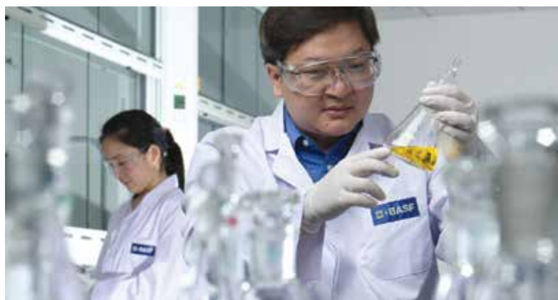
•巴斯夫PolyTHF®上海实验室员工致力为客户提供区域性的技术支持。