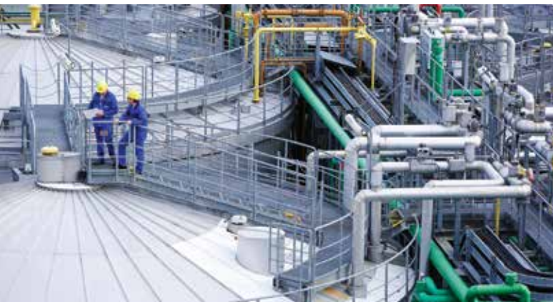
•德国路德维希港的巴斯夫一体化生产基地中的PolyTHF®工厂拥有超过三十年制造高品质PolyTHF®的经验。